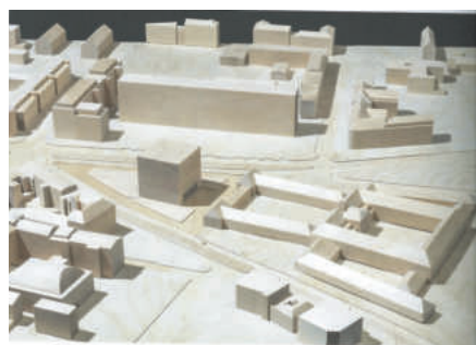
Modell aus der Arbeit Kamil Malecki, Ausstellungskatalog Grassi Museum