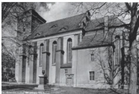
Stadtkirche Bad Muskau Foto:

Die Herbsttagung des Verbundes Zerstörte Kirchen (VZK) fand im Oktober 2018 in Bad Muskau, nahe der Grenze zu Polen, statt. Der benachbarte Fürst-Pückler-Park zählt seit 2004 zum UNESCO-Weltkulturerbe mit der Besonderheit, dass sich Polen und Deutschland darin teilen. Die 1959 endgültig gesprengte, im Zweiten Weltkrieg stark beschädigte evangelische Stadtkirche stand seit dem 17. Jahrhundert an ihrem Platz. 1605 legt Standesherr Wilhelm Burggraf zu Dohna den Grundstein für die evangelische Stadtkirche, die nach Plänen